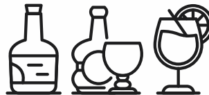
WYBÓR WYKWINTNYCH ALKOHOLI